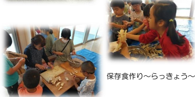
保存食作り～らっきょう～

7月の予定 8日～12日 ファミリーデー 28日(金) 誕生会 ※6月～9月はお弁当の日はありません。