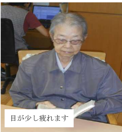
目が少し疲れます