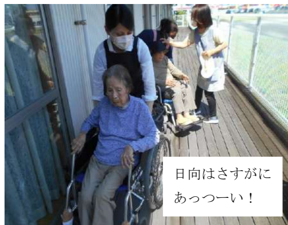
日向はさすがにあっつい！