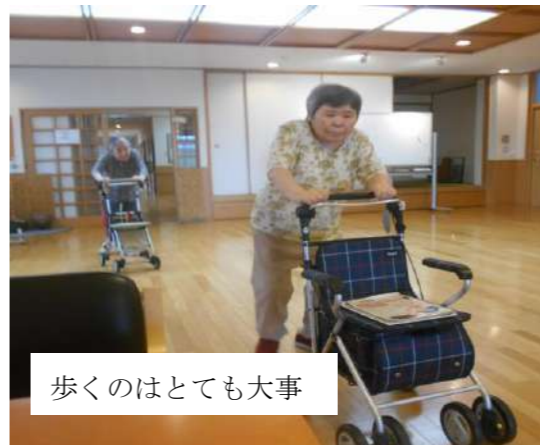
歩くのはとても大事