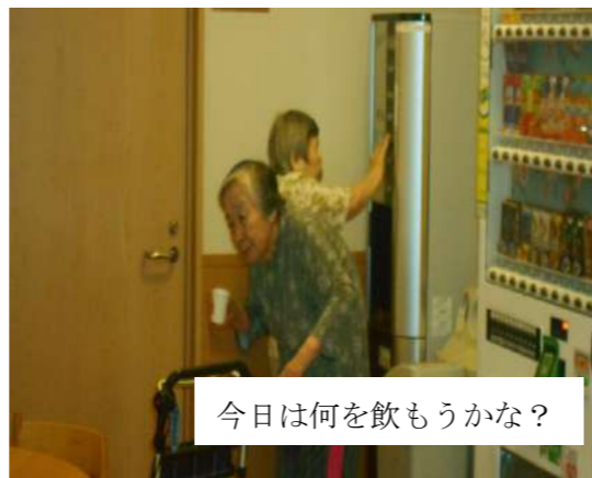
今日は何を飲もうかな？

自動車文庫(移動図書館)で借りた本を読まれる方、ウッドデッキで日向ぼっこをしたり、施設の周囲の散歩、プランターの花の水やり、洗濯物たたみなど自宅にいらした時の、生活習慣を施設にいても継続していただけるよう配慮しています。大きな行事だけでなくささやかな毎日の暮らしも大切にしております。