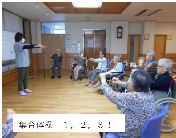
集合体操 1, 2, 3!